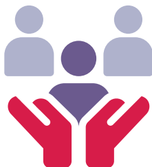
Rete aktif sosyalman