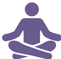
Pran swen sante mantal ou