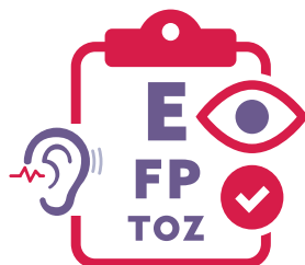
Fè yo tcheke vizyon w ak odisyon w regilyèman