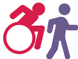
Rete aktif fizikman