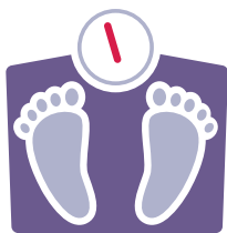
Konsève yon pwa ki bon pou sante