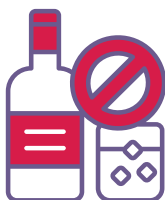
Limite oswa evite alkòl